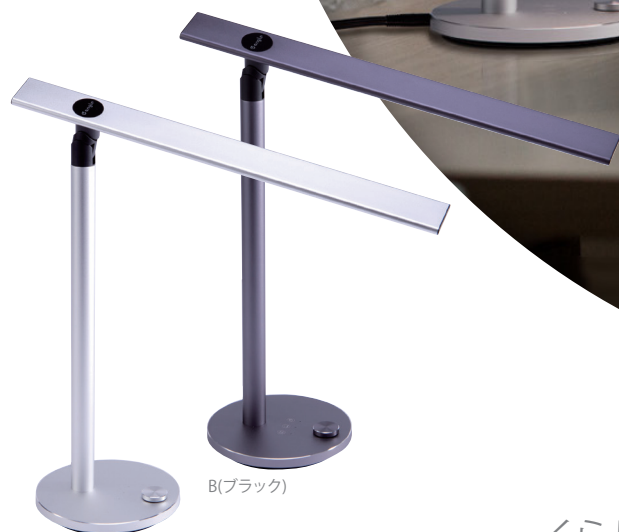
S(シルバー) 導光板パネルスタンドANG-DL-A7 (S/B)