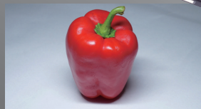
ペインティングモード

※演色性…自然光に当たった時と比べて照明で照らしたときにどの程度再現しているかを示す指標。 Ra100(最大値)は自然光が当たったときと同様の色の見え方を意味します。