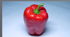
一般的な LED(Ra 80)

より自然光に近い色が表現できる 「ペインティングモード」を搭載。 高い演色性を実現しました。