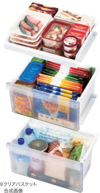
※クリアバスケット合成画像

省エネ性マークについて このマークは省エネ性能を表し、達成機種は緑色、未達成機種はオレンジ色のマークになります。商品をお選びになる時のご参考にしてください。「省エネ基準達成率」は、省エネ法に定められた2021年度基準に対する達成率を示しています。%の数値が大きいほど省エネ性が優れています。