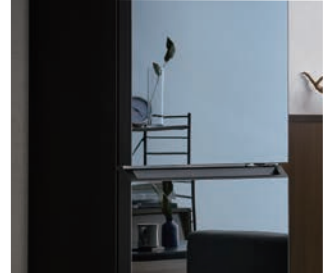
※画像はJR-M20E6(MK)のイメージです。