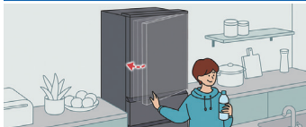
キッチン側からも