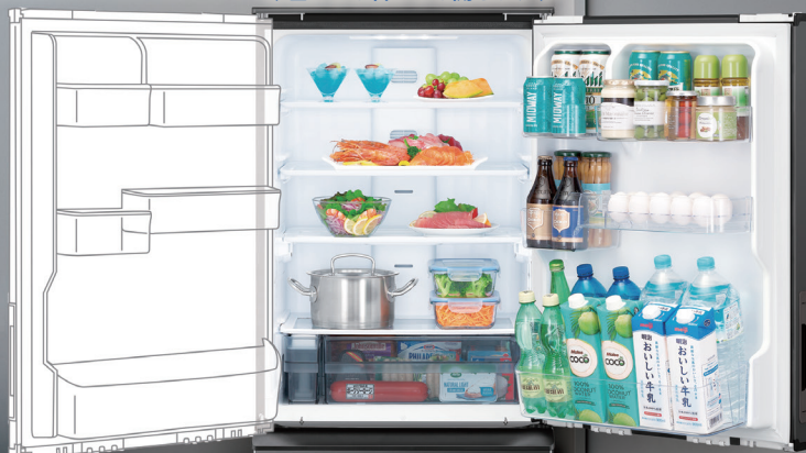
-H (ダークアッシュグレー)