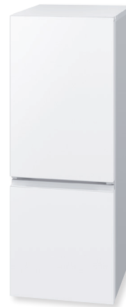
SJ-18E5-W (フレイクマットホワイト)