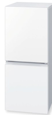
SJ-15E5-W (フレイクマットホワイト)