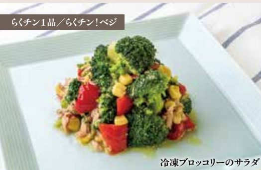
冷凍ブロッコリーのサラダ