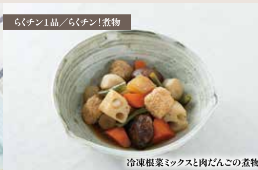
冷凍根菜ミックスと肉だんごの煮物