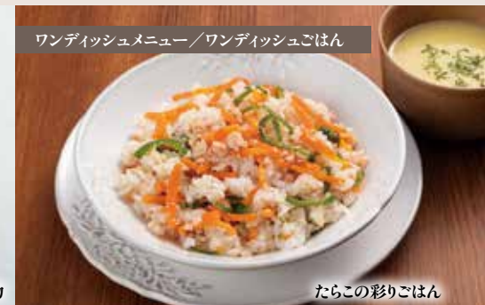
たらこの彩りごはん